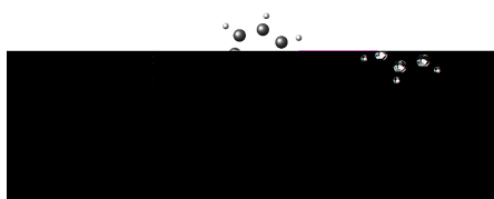
附图 2-1 这是一个样图