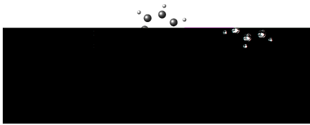
图 2-1 样图