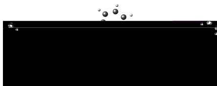
图 21 样图

单图插入：假设插入名为c06h06(后缀可以为.jpg .png和.pdf,下同)的图片，其效果如图 2-1。