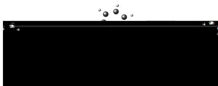
图 2-1 样图

单图插入：假设插入名为c06h06(后缀可以为.jpg .png和.pdf,下同)的图片，其效果如图 2-1。