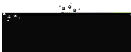
图 2-1 样图

单图插入：假设插入名为c06h06(后缀可以为.jpg .png 和.pdf，下同)的图片，其效果如图 2-1。